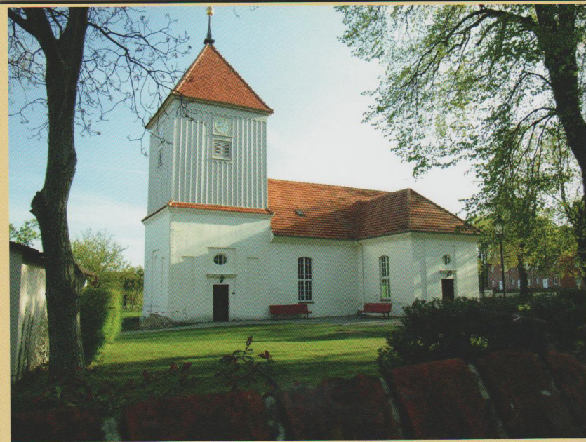
Staaken Erbaut 1436-38, der Glockenturm von 1558 wurde 1712 durch einen gedrungenen Turmbau ersetzt.