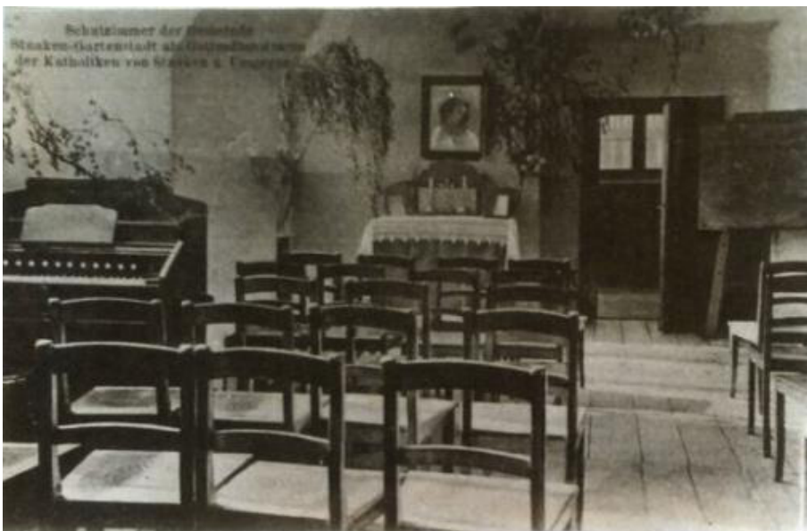
Schulzimmer in Staaken-Gartenstadt als Gottesdienstraum der Katholiken von Staaken und Umgebung