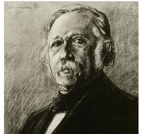
Max Liebermann, Theodor Fontane, 1896

Der Realismus Fontanes drückte sich auch darin aus, daß er die vielfältigen Formen des gesellschaftlichen Lebens, also Politik, Wirtschaft und Kultur, Dynastie, Regierung und Volk, Kirche und Kirchenlehre in die Handlung seiner Romane einbezog. Fast in jedem Roman treten Pastoren, wenn auch als Randfiguren, auf, es werden religiöse Probleme erörtert; vornehmlich wird die Glaubenshaltung und das tätige Christentum der Herrnhuter oft erwähnt, die Lehren Calvins sind Gesprächsthemen eben-