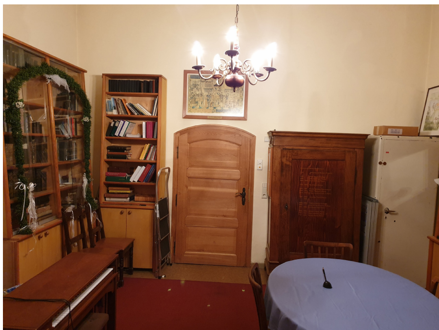
Dorfkirche Alt-Staaken, Blick in die Sakristei

verwaltung unter Pfarrer Völkel aus Falkensee die theoretische Bezeichnung „Kutscherstube“. Pfarrer in Entsendung Peter Radziwill (1987-1990 in Alt-Staaken) und Kreisarchivpfleger Pfr. Asse ordneten das Pfarrarchiv Alt-Staaken, legten z.T. neue Aktendeckel an und kümmerten sich im Rahmen der Möglichkeiten um eine ordnungsgemäße Ablage. Einiges wurde aussortiert. Nach dem Mauerfall konnten neue Aktenschränke angeschafft werden, und das Pfarrarchiv Alt-Staaken erhielt einen Platz auf der Empore der Dorfkirche. Als das Gemeindehaus nach der Neubesetzung der Pfarrstelle an der Dorfkirche nach 1991 wieder seinem Zweck dienen konnte, brachte man 1992 das Pfarrarchiv dorthin, zumal die Empore der Dorfkirche für eine neue Orgel gebraucht wurde, für die Gemeindeglieder 30 Jahre lang Spenden gesammelt hatten. Für die ältesten Archivalien und die Vasa sacra besorgte Peter Wilfert von der Kyffhäuserkameradschaft Staaken einen ehemaligen Waffenschrank aus einer aufgelösten Dienststelle der Volkspolizei der DDR in Berlin-Weißensee mit dem Vermerk MdI (=Ministerium des Innern).