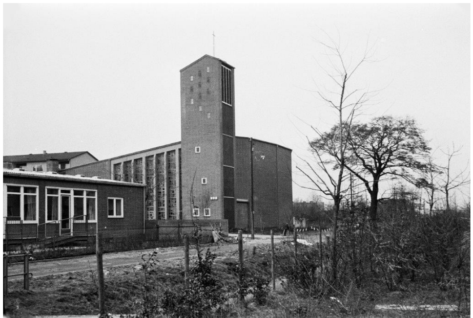
Zuversichtskirche Staaken, März 1967, Foto: W. Rachals (Sammlung Andreas Kalesse)

Die Entwürfe für die Baugruppe, die aus drei Einheiten besteht, der Kirche mit den anschließenden Gemeinderäumen im Norden, den Wohnhäusern im Westen und dem ehemaligen Kindergarten im Süden, welche sich um einen begrünten Innenhof gruppieren, lieferten das Architektenepaar Barbara und Wolfgang Vogt aus Strande