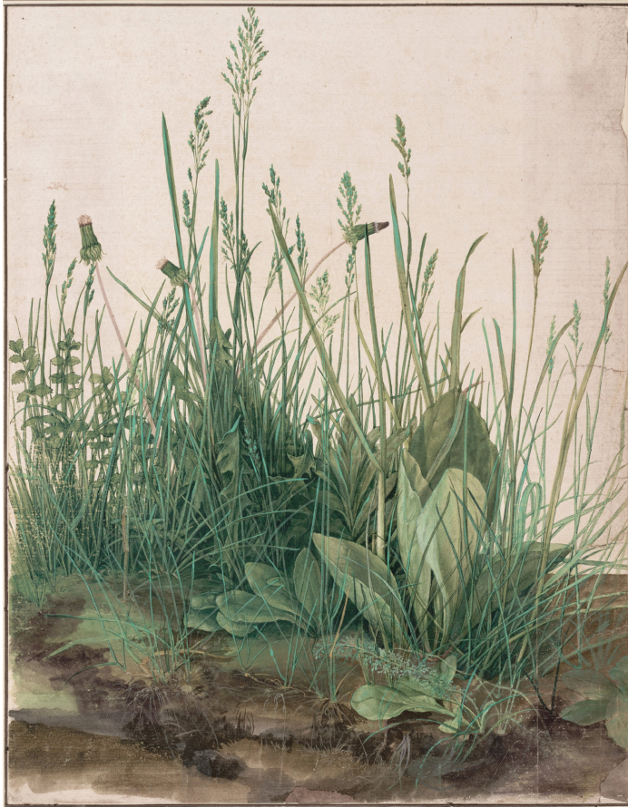
Albrecht Dürer (1471-1528, Nürnberg), Das große Rasenstück, 1513, Wien Albertina

Mitteilungsblatt des Freundeskreises der Dorfkirche Alt-Staaken e. V. Ausgabe 41 - Sommer 2019