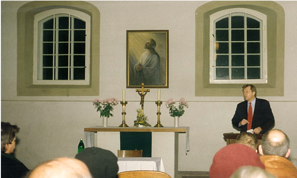
Eberhard Diepgen in der Dorfkirche Alt-Staaken