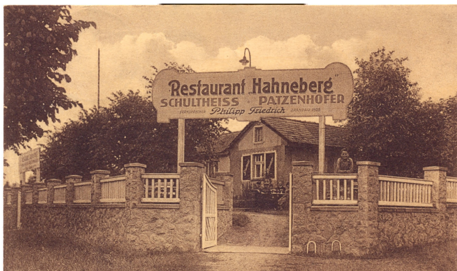
Alte Postkarte, Buchdruckerei E. Schütt, Charlottenburg Poststempel 1. Aug. 1937

Einige Angaben sind unrichtig bzw. haben sich überholt.