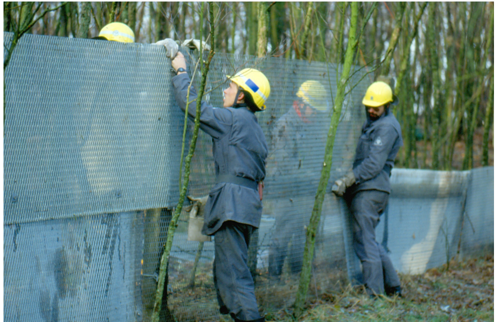
Abbau des Grenzzaunes am Hahneberg, 1990