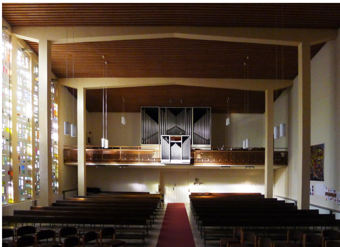
Zuversichtskirche Staaken, Blick zur Empore

Und der Friede Gottes, der höher ist als all' unsere Vernunft, er bewahre unsere Herzen und Sinne in Christus Jesus. Amen.