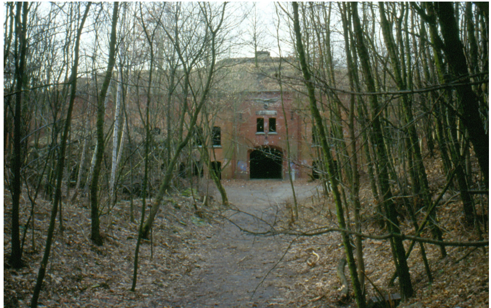
Postkarte Fort Hahneberg, ASG Fort Hahneberg

Unabhängig von der Vielfalt der Räume, Treppen und Schächte war die hervorragende hand-