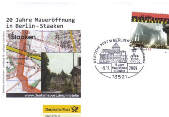
Sonderstempel der Post zum 20. Jahrestag d. Mauerfalls

Sonderstempel und Brief 20 Jahre Maueröffnung in Staaken. Das beherrschende Thema in den Medien bildete in der 2. Jahreshälfte 2009 der 20. Jahrestag des Mauerfalls.