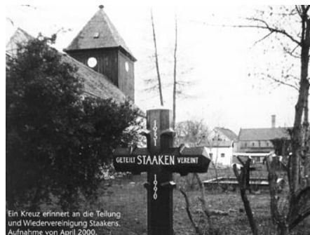
Ein Kreuz erinnert an die Teilung und Wiedervereinigung Staakens. Aufnahme von April 2009.

Ebenso ist es mit dem Gebot der Feindesliebe. Jesus ermutigt uns, im gegenwärtigen Feind den Freund von morgen zu erkennen, den Partner einer gemeinsamen Zukunft, so wie es zwischen Deutschen und Franzosen