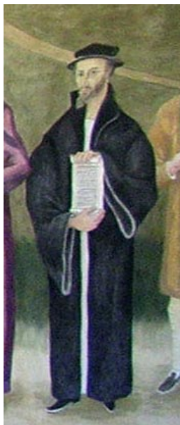
Melanchthon im Wandbild „Versöhnte Einheit“

„Melanchthon sah Brücken, wo Luther nur noch Gräben sah“, so kennzeichnete der langjährige Ratsvorsitzende der Evangelischen Kirche in Deutschland, Bischof Wolfgang Huber, einmal die Unterschiede zwischen den beiden großen Reformatoren. Denn Philipp Melanchthon, Theologe und Humanist, suchte das Gemeinsame zwischen den auseinanderdriftenden Kirchen. 450 Jahre nach seinem Tod am 19. April 1560 will die evangelische Kirche mit einem Gedenkjahr an die Leistungen des Reformators