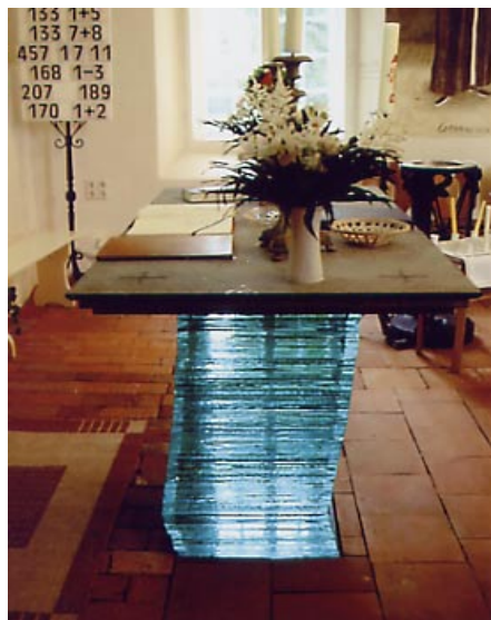
Altar mit Fuß aus Schichtglas