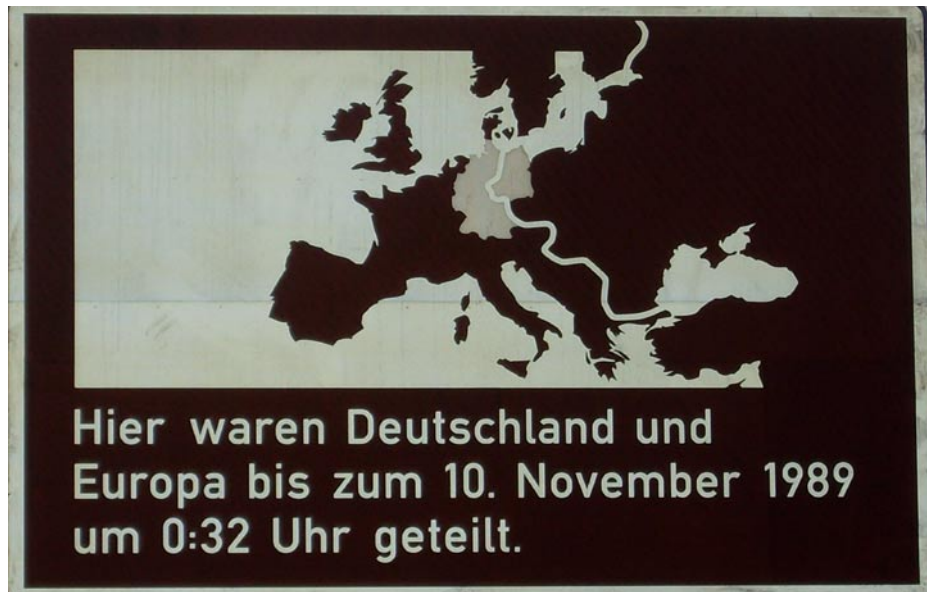
Gedenktafel an der Bergstraße

Durch den Berliner Blätterwald Ende Nov./Anfang Dez. wehte eine Gedenktafel an die Teilung an falscher Stelle, nämlich an der heutigen Stadtgrenze und nicht am eigentlichen Platz Heerstr./Ecke Bergstr. Es dauerte Monate, bis es zu einer Lösung kam. Erst am 1. April 2010 meldete die MAZ auf der Lokalseite „Der Havelländer“, dass „das verrückte Schild“ am 31. März nun den richtigen Platz gefunden hat.