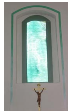
Ostfenster „Ex oriente lux“

Angesichts eines solchen gestalteten und gestalterischen Grüns fällt mir das schöne Wort Hildegards von Bingen ein: Die große Seherin spricht vom Grün als der viriditas, von der grünenden Schöpferkraft Gottes. Das möchte man gern auf diesen Altarraum übertragen, auf dass die grünende Schöpferkraft Gottes hier wirksam werde!