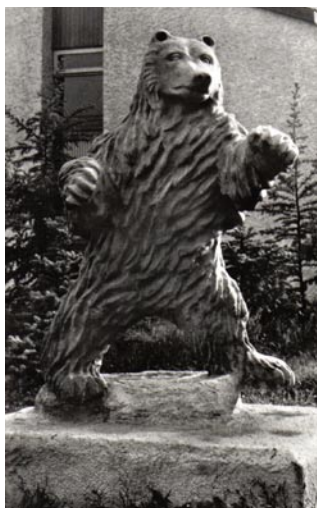
Berliner Bär an der Heerstr. v. Lily Voigt

Im Jahre 1989, also vor etwas mehr als zwanzig Jahren, wurden die Grenzen zwischen den nach dem Zweiten Weltkrieg gebildeten deutschen Staaten, der Bundesrepublik Deutschland und der Deutschen Demokratischen Republik durchlässig. Schon wenige Monate danach fielen die von der DDR errichteten Grenzbefestigungen, insbesondere die Mauer, die den Personen- und Warenverkehr zwischen den beiden Staaten weitgehend unmöglich gemacht hatte. Heute gibt es nicht mehr viel, was an das von den kommunistischen Machthabern in Ost-Berlin als „antifaschistischer Schutzwall“ gepriesene Bauwerk erinnert. Einige Postenwege sind noch erhalten geblieben und dienen Joggern und Radfahrern als willkommene Übungsstrecke und Fußgängern als erholsame Spazierwege. Vor allem die Mahnmale für die an der Mauer erschossenen Menschen, die den Weg nach West-Berlin in die Freiheit gesucht und dies mit ihrem Leben bezahlt haben, erinnern noch an das unmenschliche Grenzregime; an der Bergstraße in Staaken insbesondere