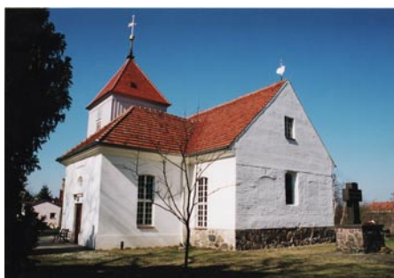
Ostansicht der Dorfkirche Alt-Staaken

..... Ich möchte die heutige Kunstpredigt zum Thema „Kunst und Kirche in der Gegenwart“ anlässlich des Deutschen Ev. Kirchentags in Bremen mit Bildern der Offenbarung des Johannes beginnen und ebenso mit einem Bild aus der Offenbarung, nämlich der Himmelsstadt Jerusalem, schließen. Darin eingebettet sind einige sakrale Tafelbilder und besonders Glasgestaltungen, die den Kirchenraum und damit uns, die Gemeinde, erleuchten und zum Klingen bringen... ..